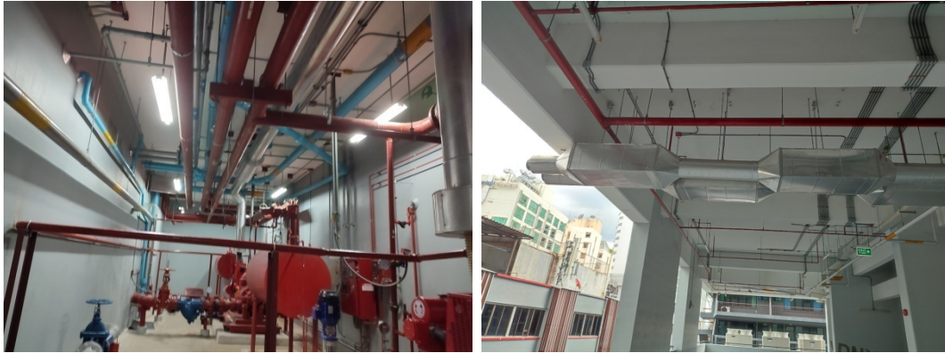
ภาพที่ 2 บริเวณดำเนินการแก้ไขท่อไอเสีย Fire Pump ที่อาคารจอดรถชั้น 8

ทรายพื้นที่จอดรถและทางวิ่งรถบนอาคาร เมื่อจัดทำแล้วเสร็จ ทำให้รถที่วิ่ง ไม่ทำให้เกิดเสียงเด้งอีกต่อไป (ภาพที่ 3)